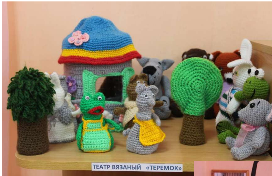
ТЕАТР ВЯЗАНЫЙ «ТЕРЕМОК»